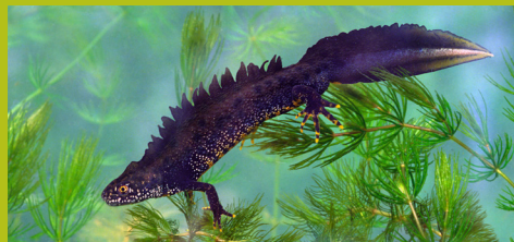
Kamsalamander - Benny Odeur

Van de vier watersalamandersoorten die we in Vlaanderen rijk zijn, spreekt de kamsalamander het meest tot de verbeelding. Onze grootste watersalamander is bovendien Europees beschermd. In Wellen komt de 'waterdraak' nog voor in vier zones. Een van die zones is het natuurgebied de Grote Beemd. Limburgs Landschap vzw liet de afgelopen jaren een netwerk van poelen aanleggen in de Grote Beemd. Hopelijk kunnen ze zich daardoor in de toekomst weer verspreiden over de Herkvallei. Een kleinschalig landschap met visvrije poelen of vijvers, hagen, houtkanten, rietkragen en knotbomenrijen vormen het ideale leefgebied voor deze soort.