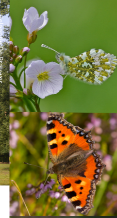
Foto's: Marcel Bex, Veerle Cielen, Heleentje De Brauer, Dany Tielens, Jean Van Hamel Tekst: Heleentje De Brauer

"De sage schildert ze ons af als kleine zwarte mannekens, gewoonlijk mismaakt, leelijk, en oud als de straat. Ze dragen lange baarden. Heel hun lijf is ruig behaard en lange zwarte nagels steken uit aan teen en vinger. Ze zijn gekleed met rooden mantel en rooden hoed, in Limburg, ook wel met zwarte rokscens, uit biezen en heidewortels geweven, met daarboven een aardig moetsken, dat ze bij dansen en springen in de hoogte gooien om het daarna met hun teenen weer op te vangen. Men stelt ze zelfs zoo klein voor dat ze op den rand van een tafelbord kunnen dansen, onder geitenblad en varens zich verschuilen, en op hun zeven gemakken plaats nemen op paddestoelen. Het is voor hen dan ook een waar plezier op den rug van tor of meikever de hei door te snorren."