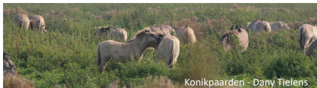
Konikpaarden - Dany Tielens

Niet alleen de kwartelkoning zoekt rust in dit gebied. Door zijn ligging in de Maasvallei met eilanden, grindbanken en grindputten, is Koningssteen-Kollegreend ook een belangrijk overwinteringsgebied voor allerlei watervogels, zoals de tafeleend. Het natuurgebied ligt eveneens op een route voor voedseltrek en seizoenstrek. Bij hevige vorst in noordelijk Nederland en Duitsland zakken vele overwinteraars naar dit gebied af, zoals de brandgans, fuut, grauwe gans, kolgans, kuifeend, smient en tafeleend. Soms worden hier ook zeldzaamheden zoals de grote zee-eend, nonnetje, middelste zaagbek, krombekstrandloper en roodhalsfuut gesignaleerd. Om al deze vogels te beschermen en voldoende rust te bieden is dit natuurgebied ontoegankelijk voor waterrecreatie.