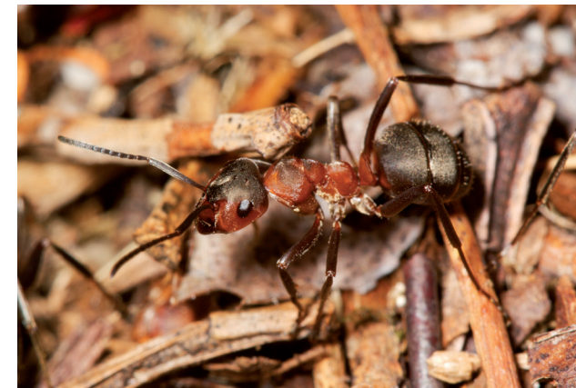
Rode bosmier