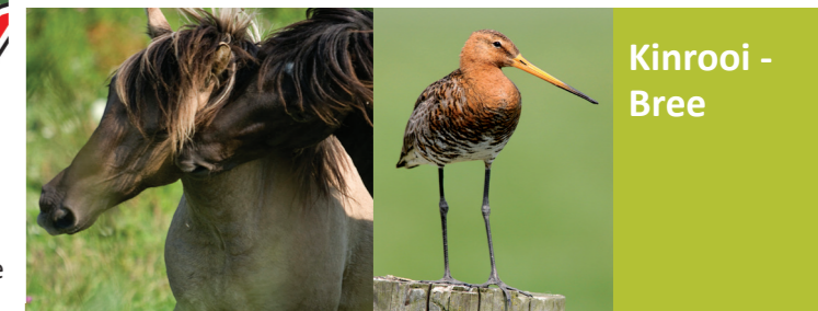
Kinrooi - Bree

Natuur in het hart van Grenspark Kempen-Broek