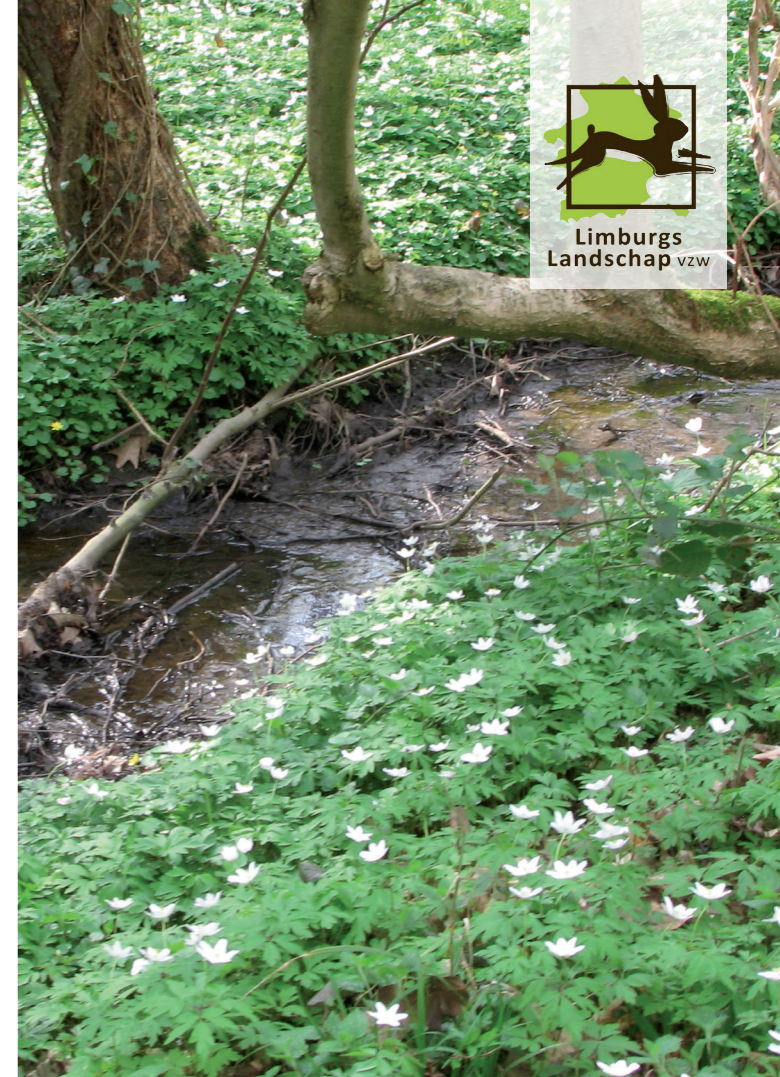
Watervalbos Een Haspengouwse parel langs de Marebeek