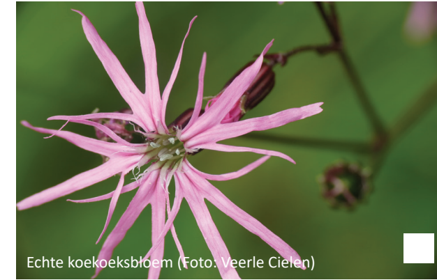
Echte koekoeksbloem